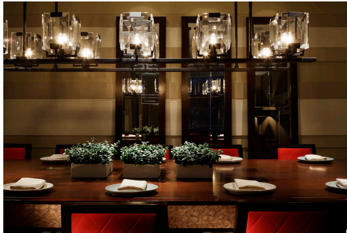
09 别致水晶灯下的长餐桌 10 点心吧台