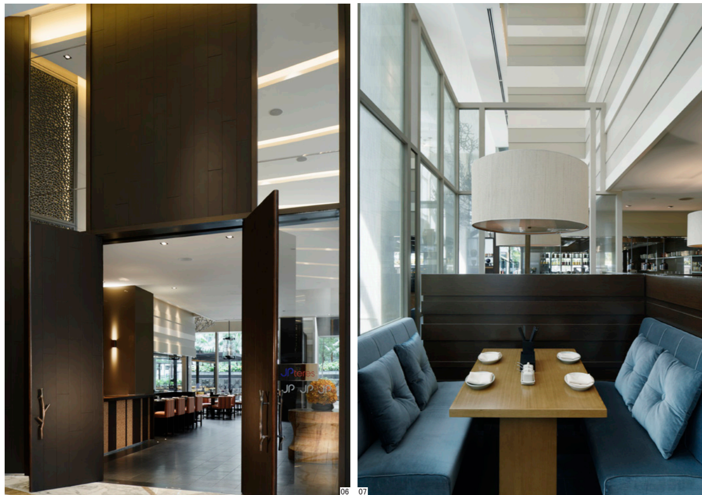
06 中庭入口 07 雅致软座 08 从室内望向入口