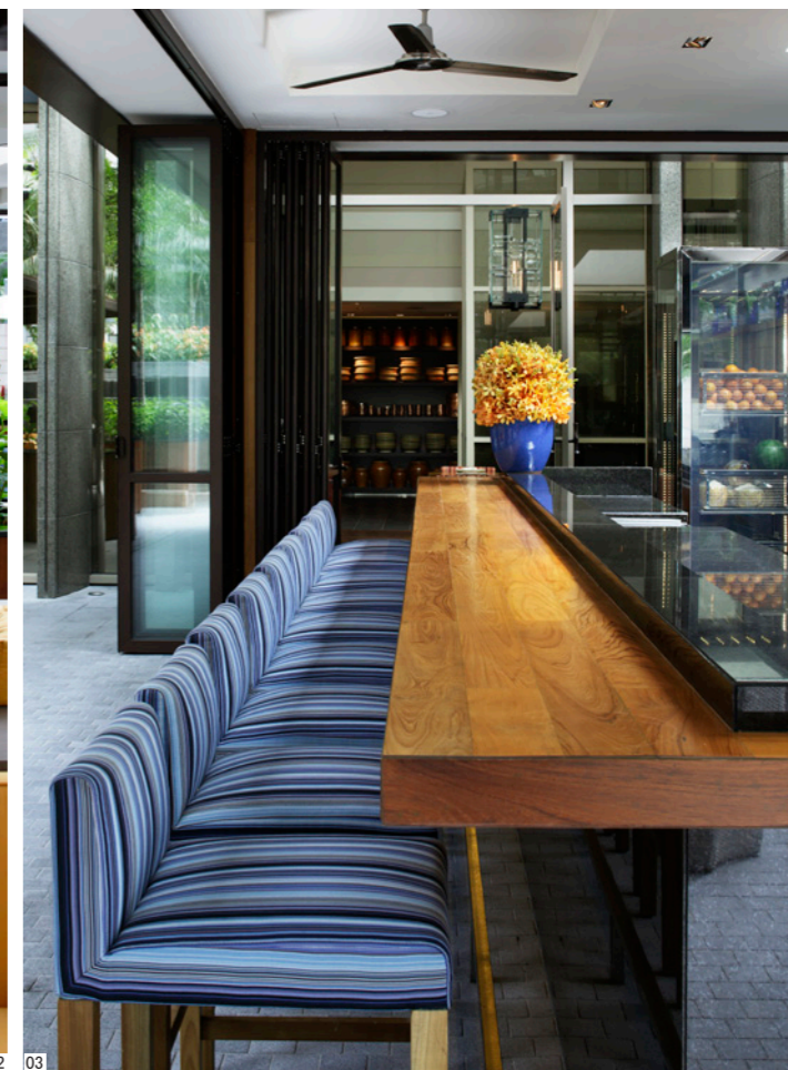
01-03 户外花园景致 04 底层平面图 05 中层平面图