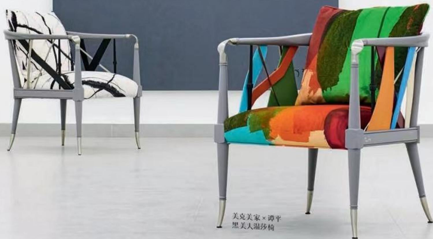
美克美家 × 谭平 黑美人温莎椅

人们无论是工作、休闲等需求， 在酒店栖息和度过的时间， 早已不是以往狭义的旅途中暂时栖身之地， 而变得丰富和必需。